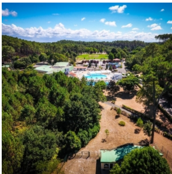
Les Villages sous les pins